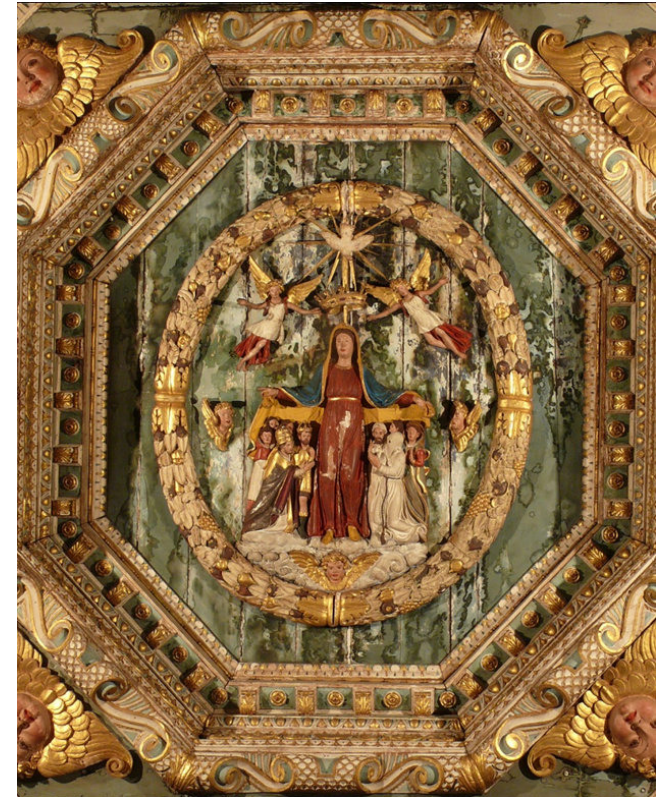
Rosone centrale della Chiesa di S. Maria del Gonfalone (Fano)

CARITAS DIOCESANA Fano • Fossombrone • Cagli • Pergola